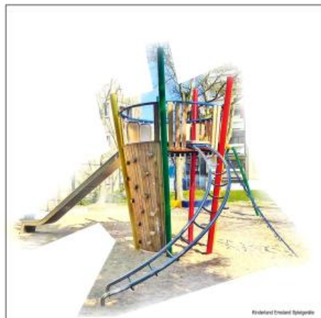
Kirchland Umwelt Spielgeräte