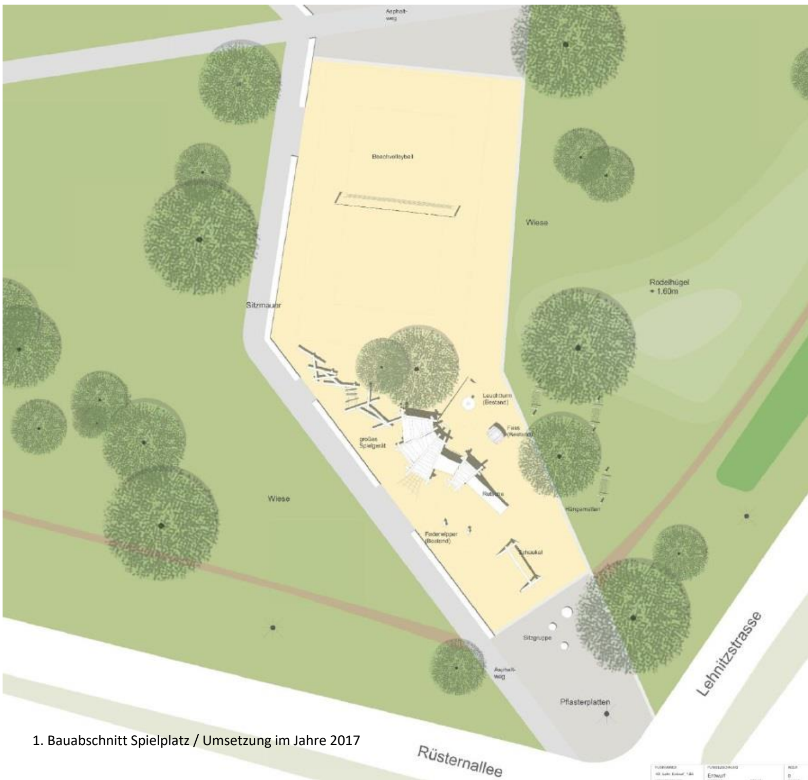
1. Bauabschnitt Spielplatz / Umsetzung im Jahre 2017