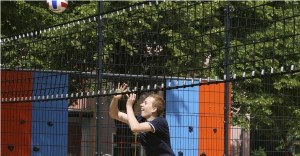
Beispiel eines stabilen Volleyballnetzes