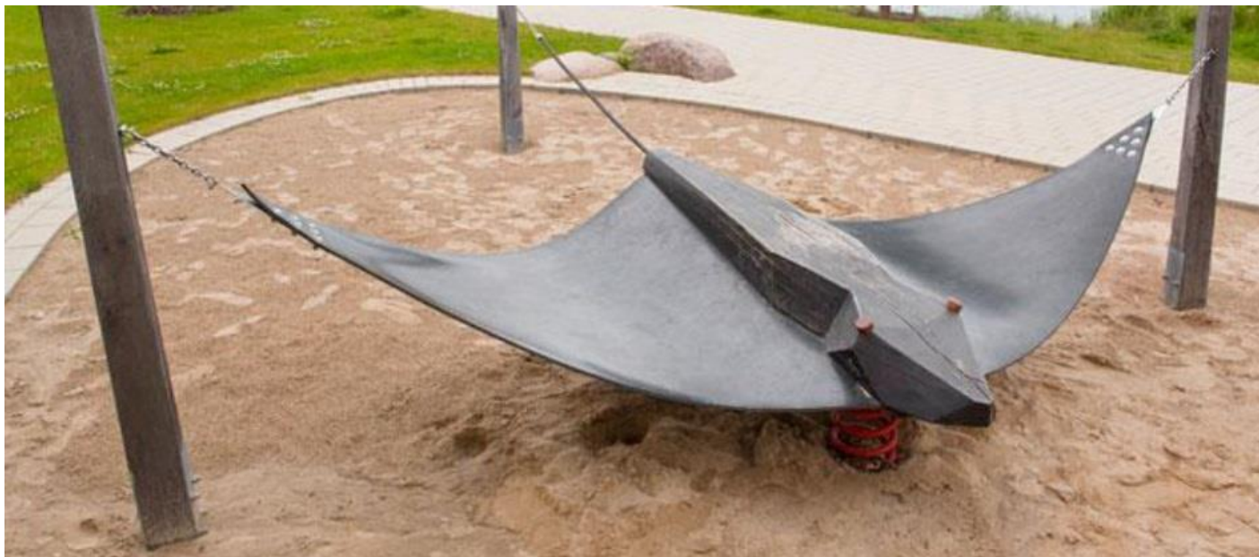
Beispiel neues Wippengerät